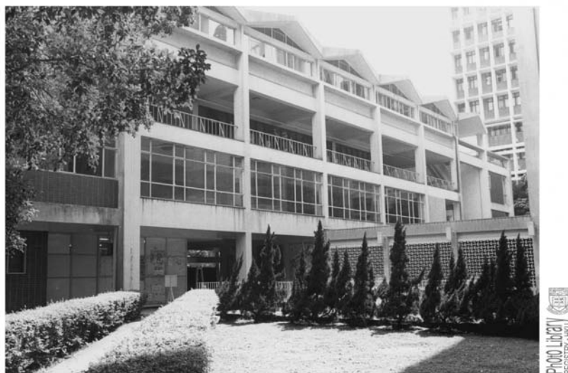
70年代初的學生會大樓，圖右上方為紐魯詩樓

在政府資助下，大學拆卸原有的余東璇體育館，以興建新學生會大樓。1952年，雅麗珊郡主為此樓揭幕，學生會遷進新樓。此樓座落於圖書館舊翼與本部大樓之間，即圖書館新翼現址。