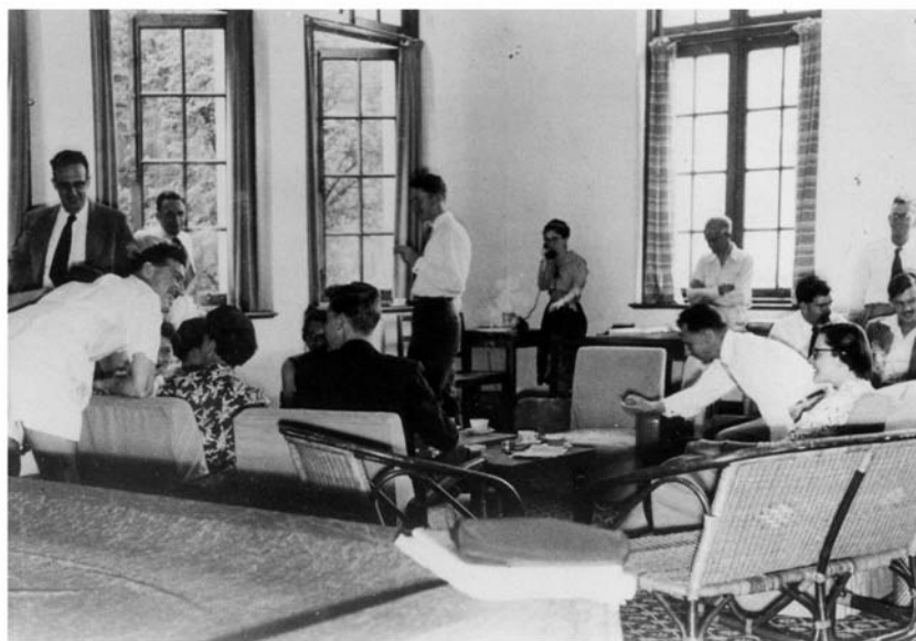
50年代教師與學生在同學會大樓內的教職員聯誼會聚會