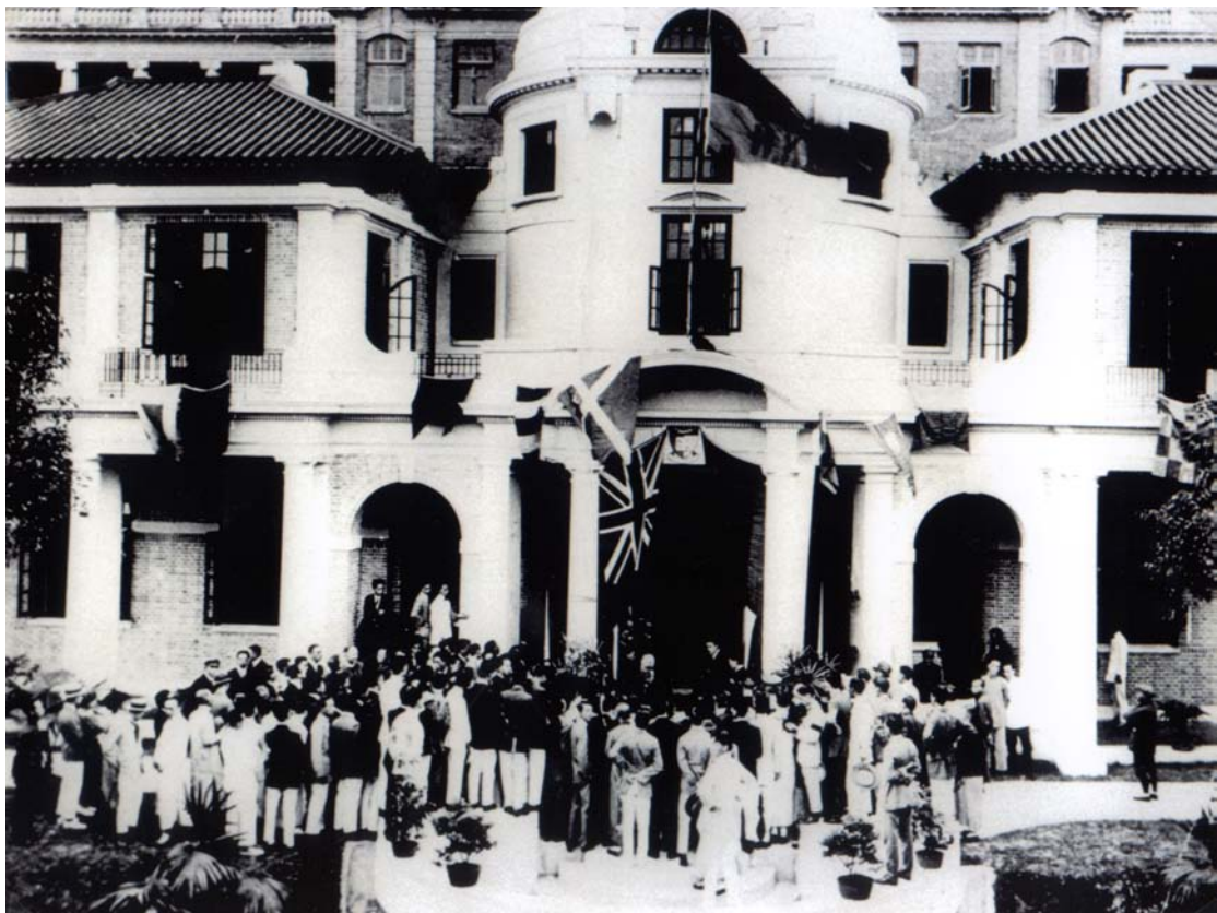
圖為University Union Building (同學會大樓，即現時的孔慶熒樓)開幕典禮的盛況(1919)

今日，呂大樂教授將會帶大家遊走這些今昔的"蒲點"，為你講述不同時代的故事。呂教授畢業於香港大學及牛津大學，現為香港大學社會學系系主任。