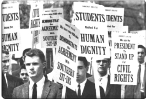
60年代美國的學生運動

自1960年代以後，隨著政府助學金和貸款的增加，來自基層的學生也能入讀香港大學。