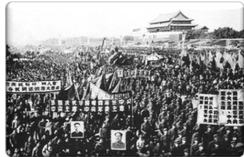
文化大革命後的中國

1966-76年的中國文化大革命、1968年所發生的「布拉格之春」事件、1969年的港大校政改革，以至於歐美等地的學生運動及香港的中文運動等，都掀起了一連串在香港學生運動。