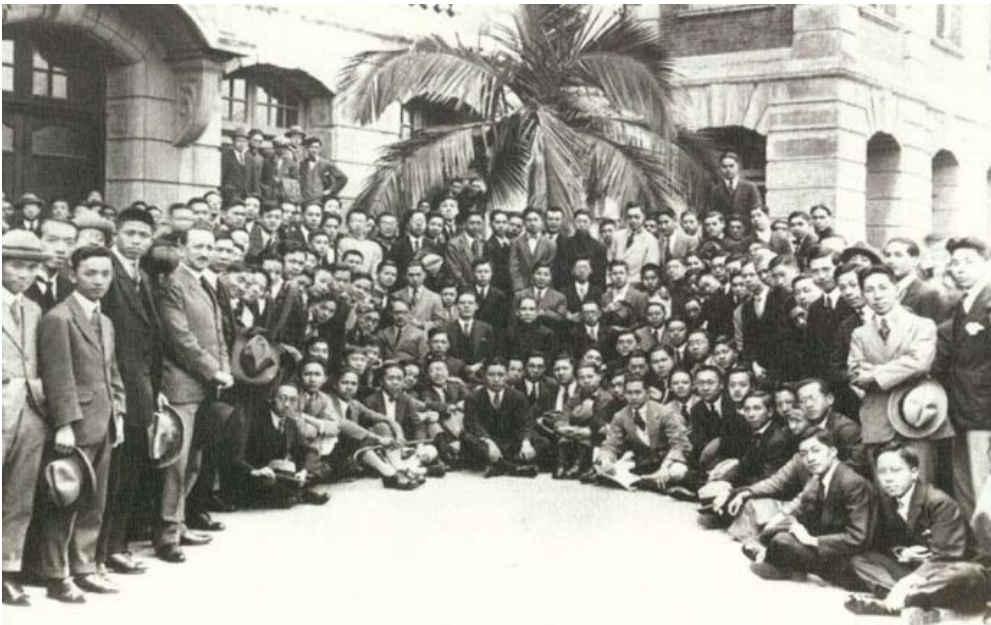
1923年，學生會邀得孫中山先生於2月20日重臨香港大學， 坐在孫先生右邊的是港大學生會會長何世儉。

學生會現時共有125個屬會，包括校園傳媒、院會及學術會、舍堂學生會、體育屬會(組成體育聯會)、文化屬會(組成文化聯會)及學社屬會(組成學社聯會)。