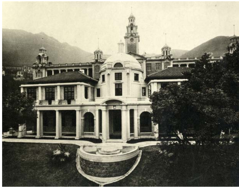
早期的同學會大樓

學生會的雛形是一個由教師與學生所組成的組織，最早期的會址位於本部大樓。後來得到遮打爵士、大學時任署理校長佐敦教授及其他社會賢達捐助，於1919年建成了University Union Building (中文名為同學會大樓，即現時的孔慶熒樓)，由時任港督司徒拔揭幕。教職員聯誼會會所其後遷入此大樓，成為教師與學生聚會點。1986年，大樓命名為「孔慶熒樓」，以表揚孔氏對大學的捐助。此建築於1995年被香港政府列為法定古蹟。現為音樂系的所在地。