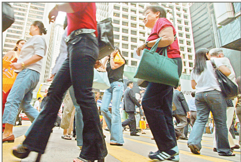
早期懷孕婦女應盡早接受產前檢查，確保母嬰健康。

最後，如果確定懷孕，最好在停經後盡早接受檢查。此外，在懷孕期間，如出現下身流血或下腹部出現不明原因的隱痛或酸脹，應提高警惕，接受醫生診斷。故此，所有早期懷孕的婦女都應配合醫生接受檢驗，維護自身健康。