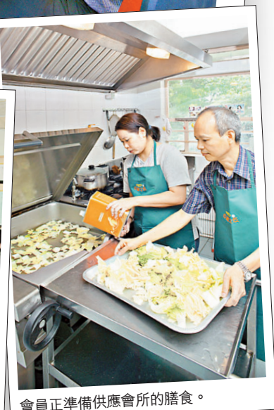
會員正準備供應會所的膳食。