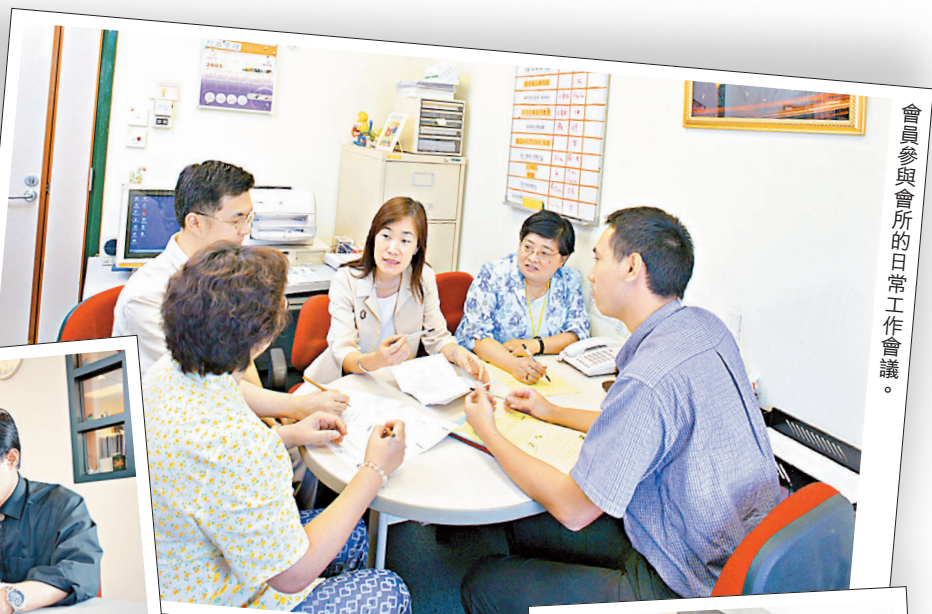
會員參與會所的日常工作會議。

自己有多種以上的徵狀，便請盡快請教醫生，盡早接受適當治療，以減少或避免疾病可能造成的傷害。