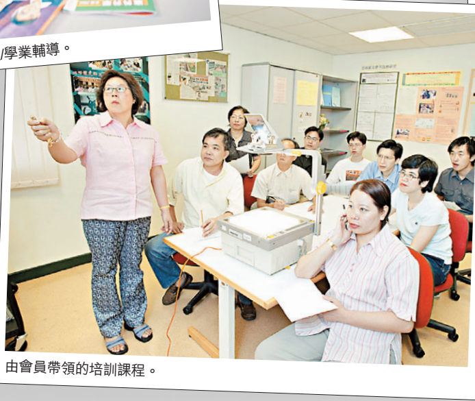
由會員帶領的培訓課程。