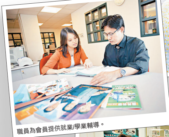
職員為會員提供就業/學業輔導。

由於科技的進步，我們對腦部的結構和功能了解漸漸增加。近代醫學一般相信精神病是與某些神經系統的分泌失調有關，而其他因