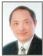
撰文：吳敏倫教授 香港大學醫學院 精神醫學系

性健康是健康的一部分。現今醫學界對健康的定義很廣泛，沒有病患並不足以被定義為健康。根據世界衛生組織的定義，健康包括發展理想的生活和個人潛能、可以過幸福的生活、有個人的選擇權和自由意志，並且能幫助別人過幸福的生活。