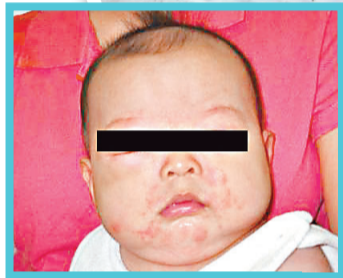
皮膚紅腫和出風疹是常見的食物過敏反應。

香港大學李嘉誠醫學院兒童及青少年科學系出版「不能不認識的兒童病系列」圖書，講解濕疹和食物過敏。