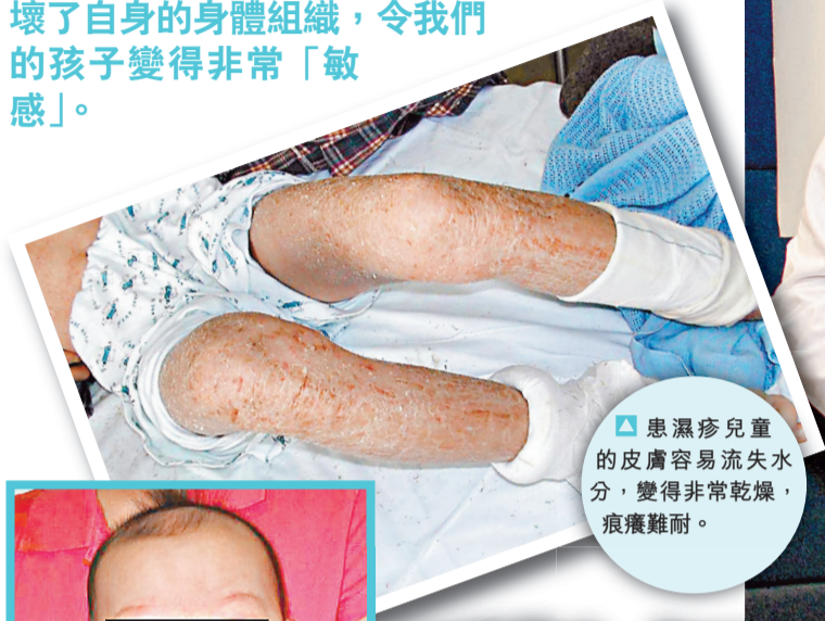
患濕疹兒童的皮膚容易流失水分，變得非常乾燥，痕癢難耐。

過敏是免疫系統失調的一種，免疫系統不但在細菌來襲時發動攻擊，同時會誤認無害的外來物質為「敵人」，發出信息使血管擴張、發癢、肌肉收縮等去對抗，實際上卻是產生了過度激烈的反應，破壞了自身的身體組織，令我們的孩子變得非常「敏感」。