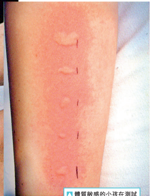
▶ 體質敏感的小孩在測試10至15分鐘後，會出現類似風疹、蚊咬的反應。