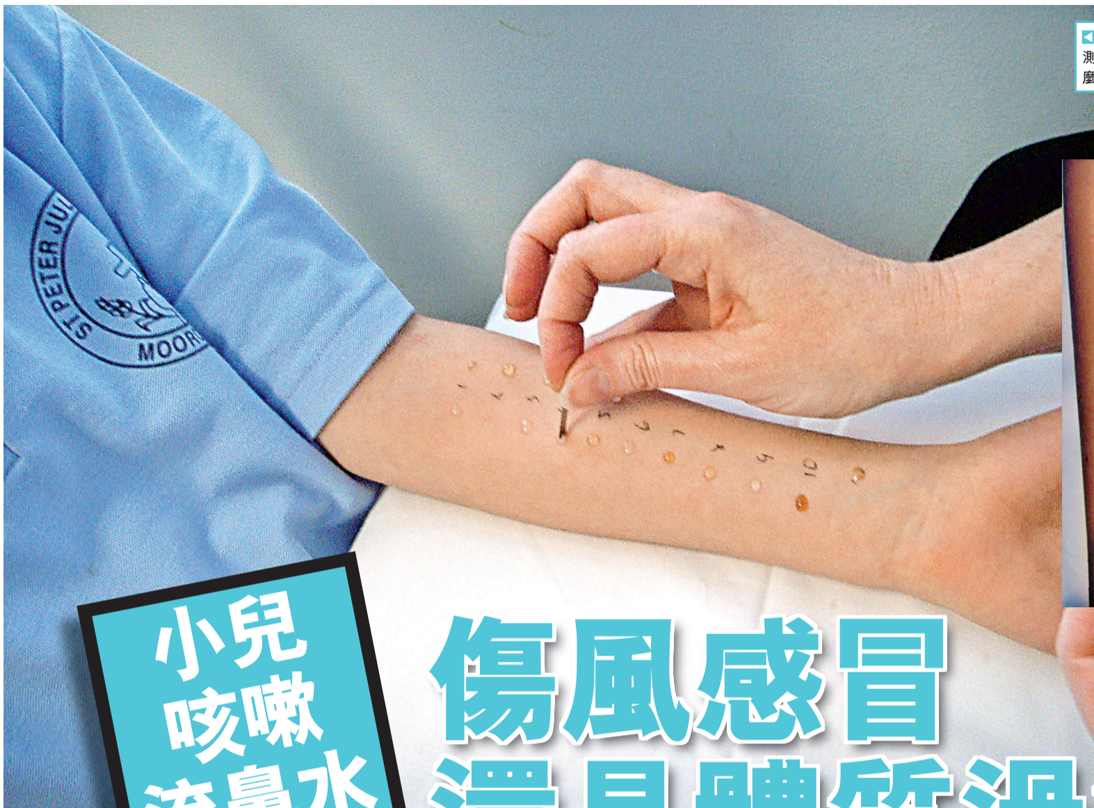
◀ 在前臂進行皮膚針刺測試，可找出小孩對甚麼東西敏感。