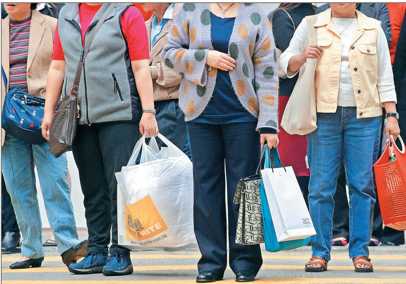
女性年紀漸長，容易患上多種婦女病，如乳癌及子宮頸癌便是其中之一。

檢查的原理是用陰道鏡放大子宮頸觀察，再加上不同的藥水輔助，將不正常的地方顯明，然後取組織活檢。活檢化驗結果若屬最輕