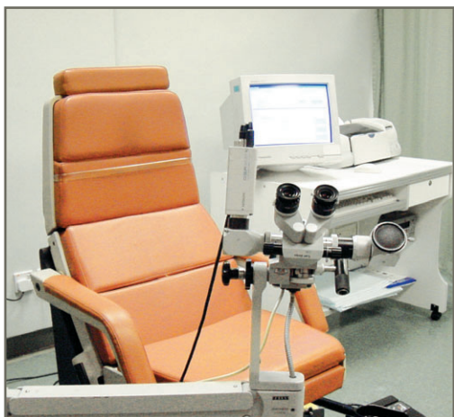
陰道鏡可放大子宮頸觀察，預防患上子宮頸癌。

中，從而檢查盆腔內的生殖器官，包括子宮及兩側卵巢。通過超聲波探察，該部位的影象便能顯現在螢光幕上。在檢查的過程中，病人通常不會感到不適。