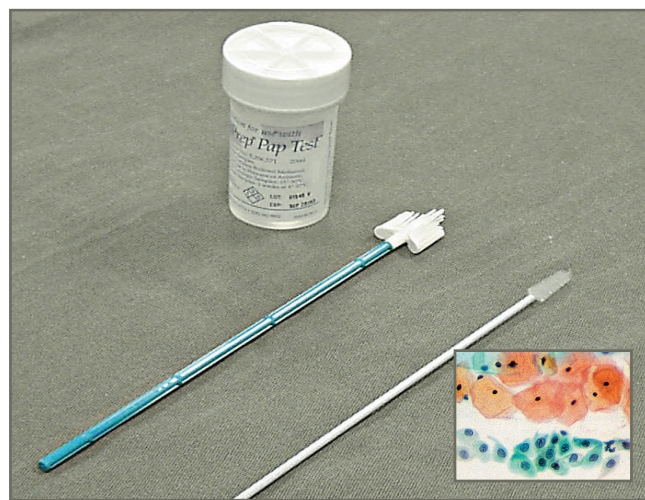
定期做子宮頸細胞檢查，可預防子宮頸癌。