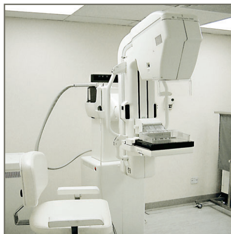
乳房X光造影機，可檢查婦女有否患上乳癌。